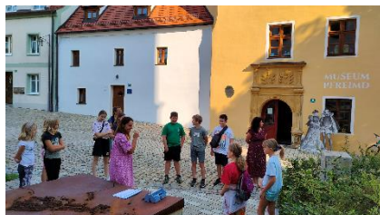
Text/Bild: S. Most

In den Räumen des Bürgerhauses mussten die Kinder knifflige Aufgaben lösen, um eine geheime Depesche zu finden. Der Rundgang durch das Gebäude stellte eine spannende Herausforderung dar und förderte Teamarbeit sowie kreatives Denken. Zum Abschluss erhielten die Kinder noch ein erfrischendes Eis.